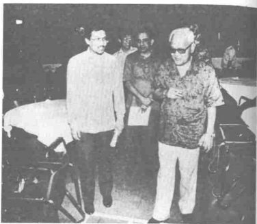
Pak Sako mengiringi Dato' Seri Anwar Ibrahim di majlis makan malam mengenang jasanya di Balai Budaya, Dewan Bahasa dan Pustaka