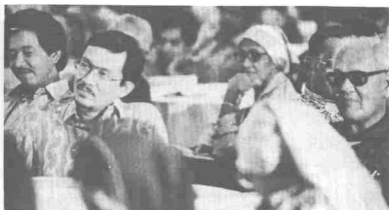
Duduk semeja dengan Dato' Seri Anwar Ibrahim dalam satu majlis makan malam untuk Pak Sako