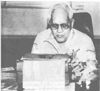
Sedang tekun menaip rencana untuk akhbar.