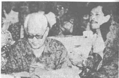
Pak Sako dan isteri dalam satu majlis makan malam