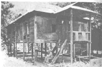
Bersendirian di pondoknya yang terletak di kebun buah-buahannya